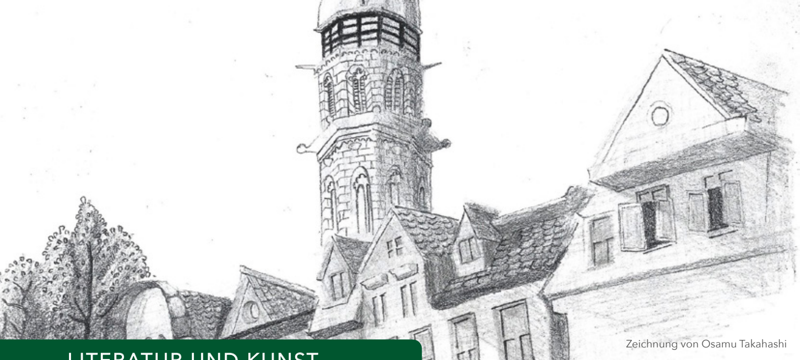
Zeichnung von Osamu Takahashi